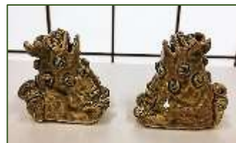
<参考>こま犬の大きさ 約 7 cm

1 セット 900 円 (税込) 数量限定 いぬ年の生まれで、陶器のこま犬の収集、研究家であった本多静雄氏の生誕 120 年を記念して製作、販売いたします。 あ・うんの形のこま犬はペン立てとメモばさみになっています。