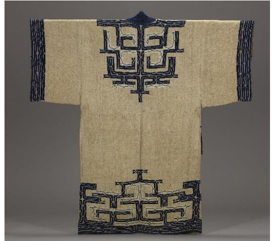
イラクサ地切伏刺繍衣裳（テタラベ）丈126cm 樺太アイヌ【日本民藝館蔵】