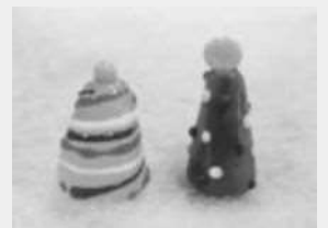
(2)クリスマスツリー

参加費:(1)3,400円(中学生以下3,000円) (2)3,300円(中学生以下2,900円)