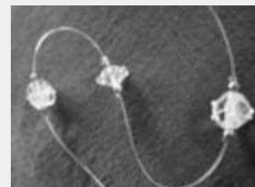
(1)サンキャッチャー