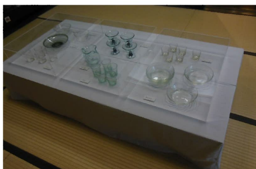
アクリルケース（小）