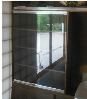
アクリルケース（中）