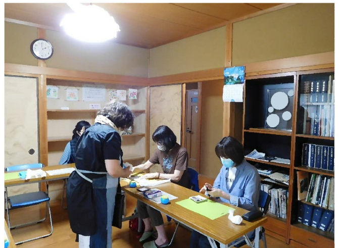
作者によるワークショップ