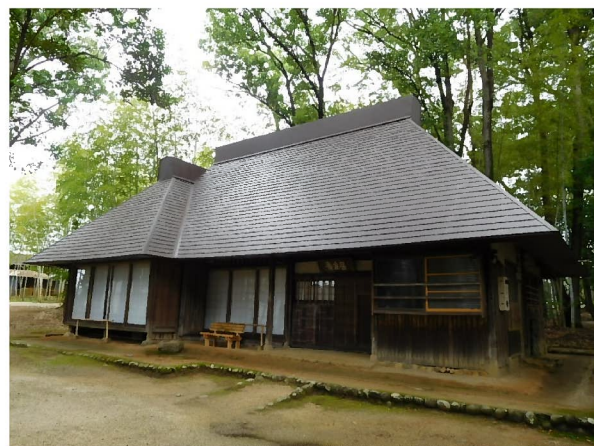
豊田市民芸の森 田舎家