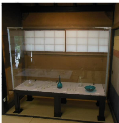
アクリルケース（大）