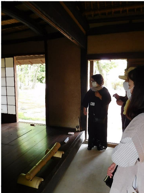
作者によるギャラリートーク（展示解説）