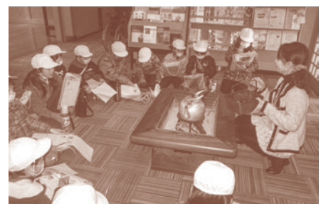
冬の生活道具 火鉢を体感 寒い冬の1日、あたたかい火鉢を囲んで当時の暮らしに思いを馳せる学習プログラムです。

例えば、平安時代の窯、猿投古窯(さなげこよう)について、授業でとりあげてみませんか。やきものの歴史や復元窯による陶芸作品づくり、収蔵品の鑑賞、昔のくらし体験など、地域の博物館施設を利用した体験型の学習プログラムを提供します。まずはお気軽にご相談ください。