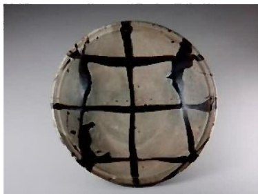
白釉黒流描鉢 濱田庄司 1963年 日本民藝館蔵