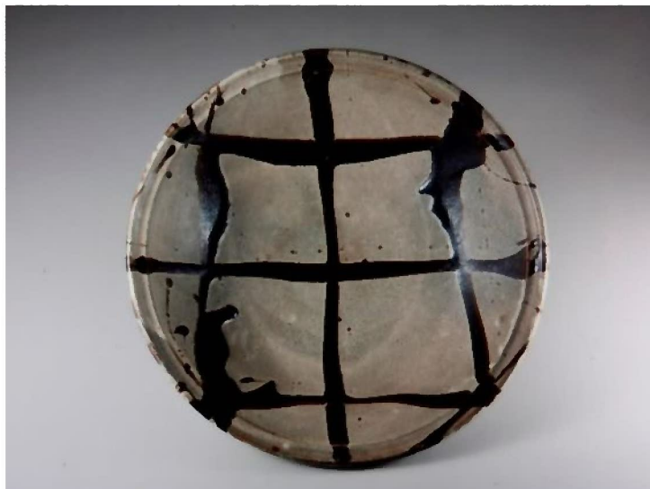
白釉黒流描鉢 濱田庄司 1963年 日本民藝館蔵

[会 期] 令和3年10月26日(火)～令和4年1月30日(日) [会 場] 豊田市民芸館第(1・2民芸館) 〒470-0331 愛知県豊田市平戸橋町波岩86-100