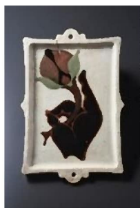
白釉地花手文陶板 河井寛次郎 1951年 日本民藝館蔵