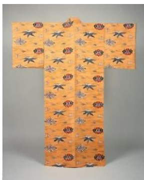
黄地松竹梅文着物 芹沢銈介 1933年 日本民藝館蔵