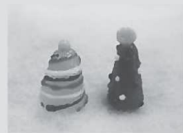
(3) クリスマスツリー