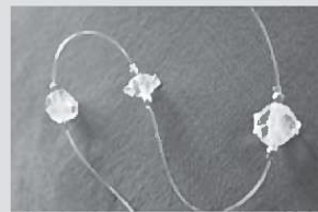
(1) サンキャッチャー