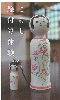
こけし 絵付け体験