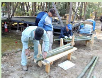
部会でのベンチ製作

【森の環境づくり部会】 4月のオープニングに向けて2/28にベンチの製作を行いました。オープニングでは、竹筒を使った甘酒ふるまいなどを企画しています。自然と触れあい、手や体を動かすのが好きな方はぜひご参加ください。